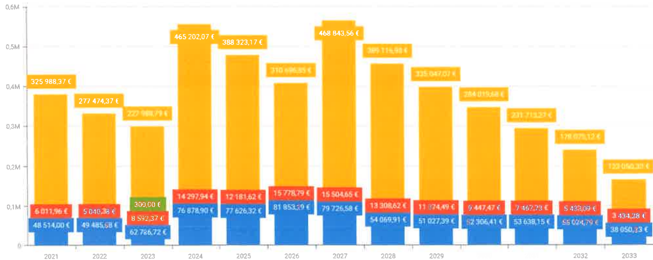
Evolution de la dette : 2021 à 2033

Un nouvel emprunt de 240 000 €uros sur une période de 12 ans a été signé fin 2025 afin de financer une partie des travaux de la Maison des Assistantes maternelles (MAM) actuellement en construction 4, Le Malpas 19120 ALTLAC.